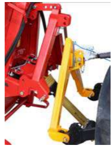
Greitasis užkabinimas A- rėmas (trikampis)