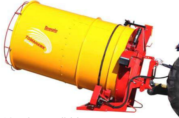
1,25 m būgno prailginimas