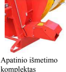
Apatinio išmetimo kompleksas