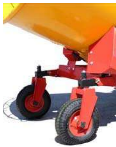
Atraminių ratų kompleksas