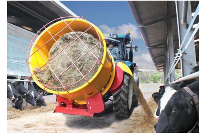
■ Supjaustytas silosas lengviau ėdamas, nei silosas ryšuliuose. Geresnis prieaugis.