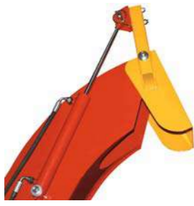
Hidraulinis deflektorius (kreipiančioji)