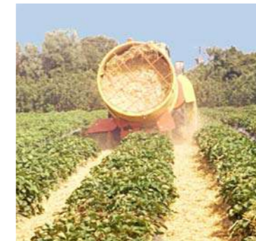
Ilgas pjaustymas idealiai tinka visų vaisinių augalų mulčiavimui.