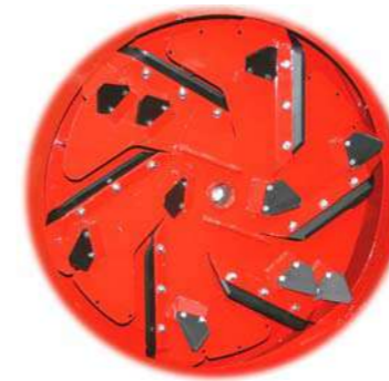
Savaiminis išsivalymas pjovimo metu - gali dirbti su bet kokia medžiaga, įskaitant šiaudus saugomus lauke.