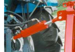
Hidraulinė centrinė traukė