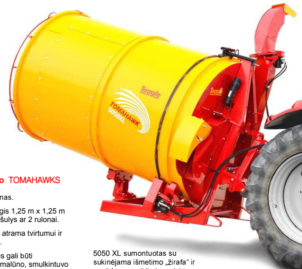
5050 XL sumontuotas su sukiniama išmetimo „žirafa“ ir papildomu variklio komplektu.