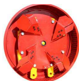
Plaktukų sistema didesniams atsparumui arba akmenuotoms medžiagoms ir labai trumpam smulkinimui.