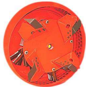
Peilių sistema aukštai padavimo normai - naudoti tik su sietais kurių skylių skersmens dydis didesnis kaip 12 mm.