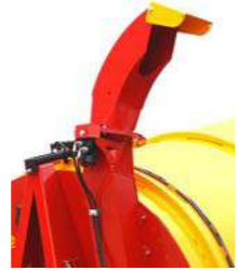
Sukinėjama "žirafa" su papildomu variklio komplektu