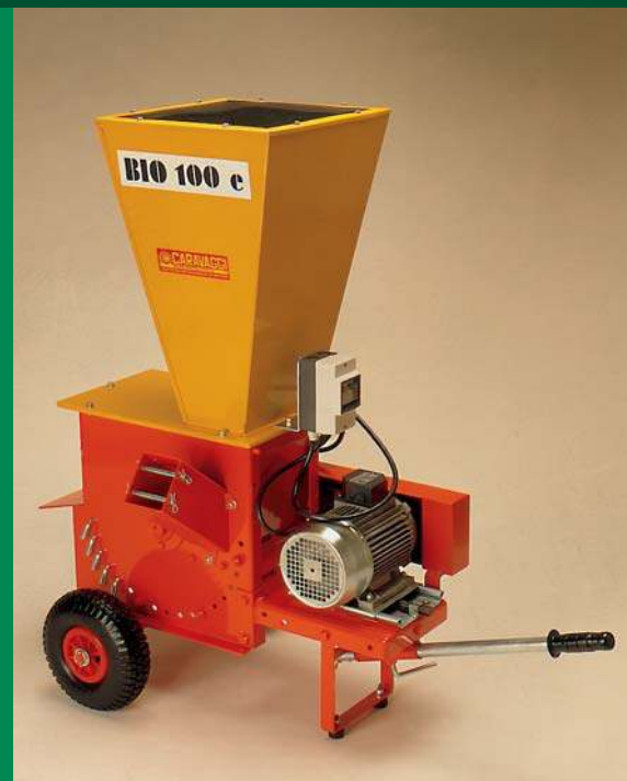
Bio 100 elettrico