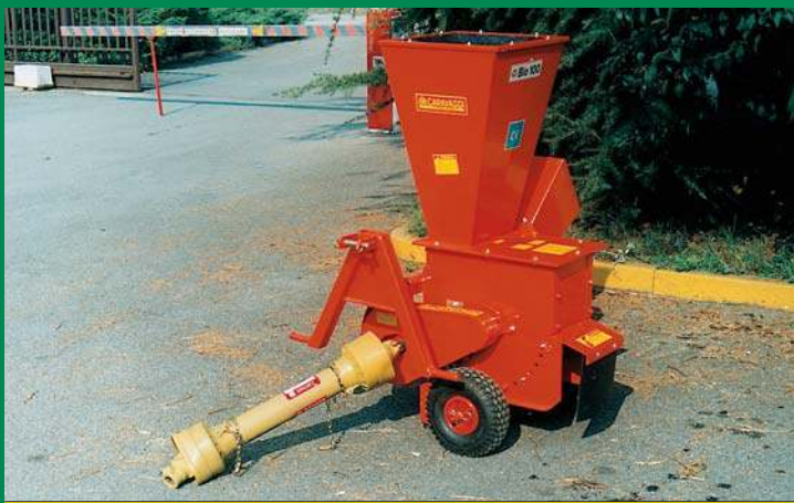
Bio 100 CON ATTACCO TRATTORE