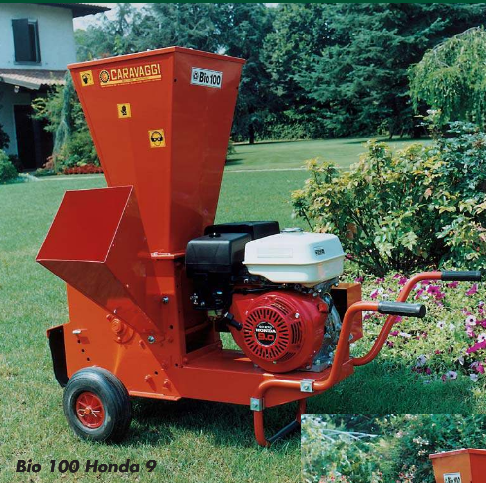
Bio 100 Honda 9