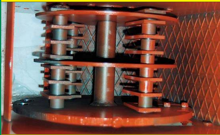
ROTORE A MARTELLI