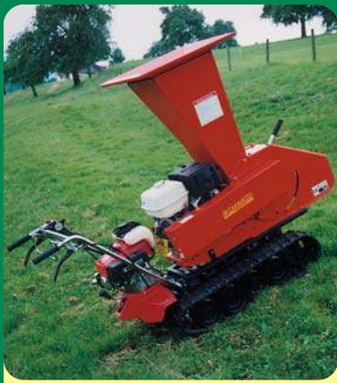
BIO 150 BENZINA SU CINGOLATO