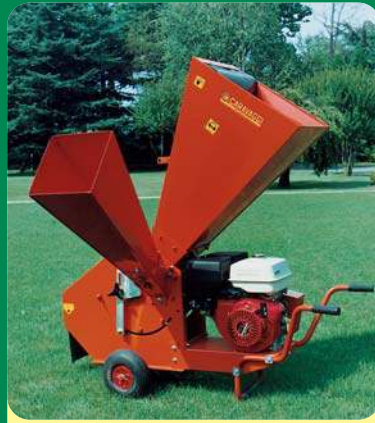
BIO 150 BENZINA -13 CV