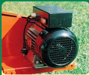
MOTORE ELETTRICO 3 E CV - 220 / 380 V