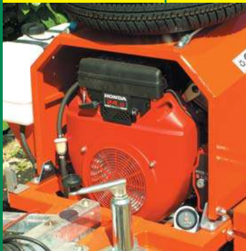
MOTORE BENZINA 24 CV