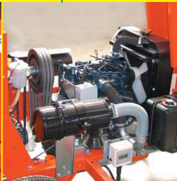
MOTORE DIESEL 27 CV