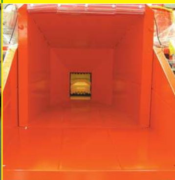
DOPIO RULLO DI ALIMENTAZIONE