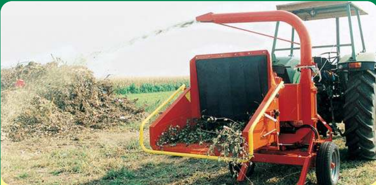
Cippo 25 ATTACCO PER TRATTORE