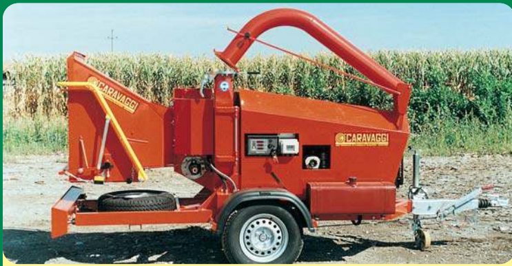
Cippo 25 STRADALE 80 KM/h