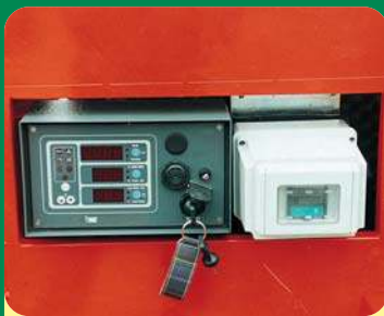
QUADRO AVVIAMENTO E DISPOSITIVO NO STRESS