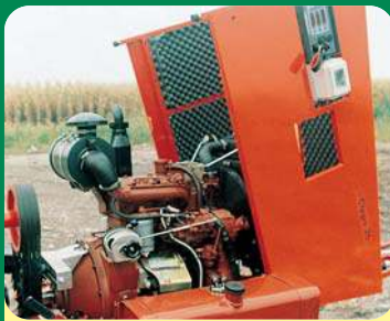
APERTURA COFANO ISPEZIONE MOTORE